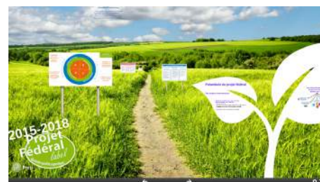
La présentation du projet lors de l'AG

L'évaluation annuelle du projet fédéral sera un temps fort, partagé et ouvert à l'ensemble du réseau, nous permettant d'ajuster, le cas échéant, les priorités à mettre en œuvre.