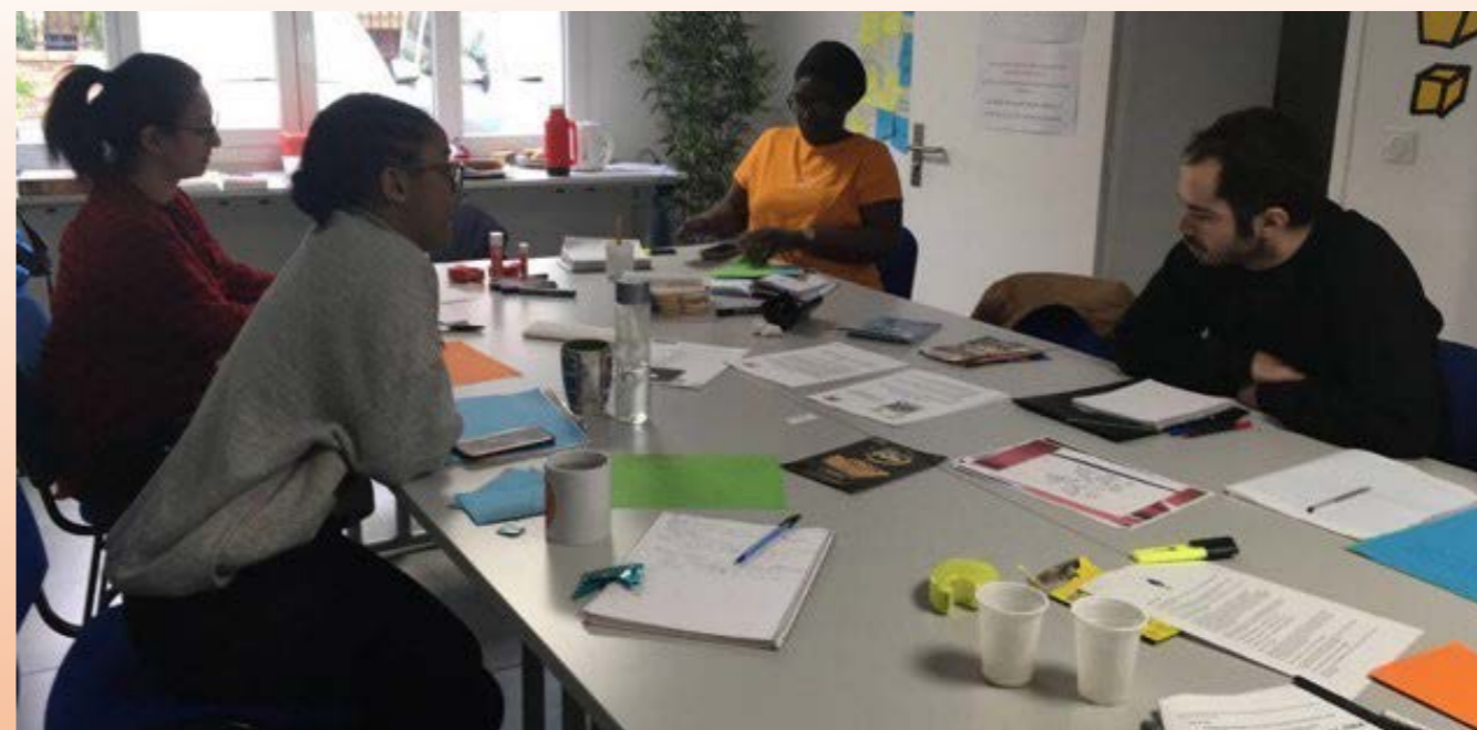
Formation Outils Participatifs du 15 mars

18 participant.e.s dont 5 de Seine-Saint-Denis pour la session 2018-2019