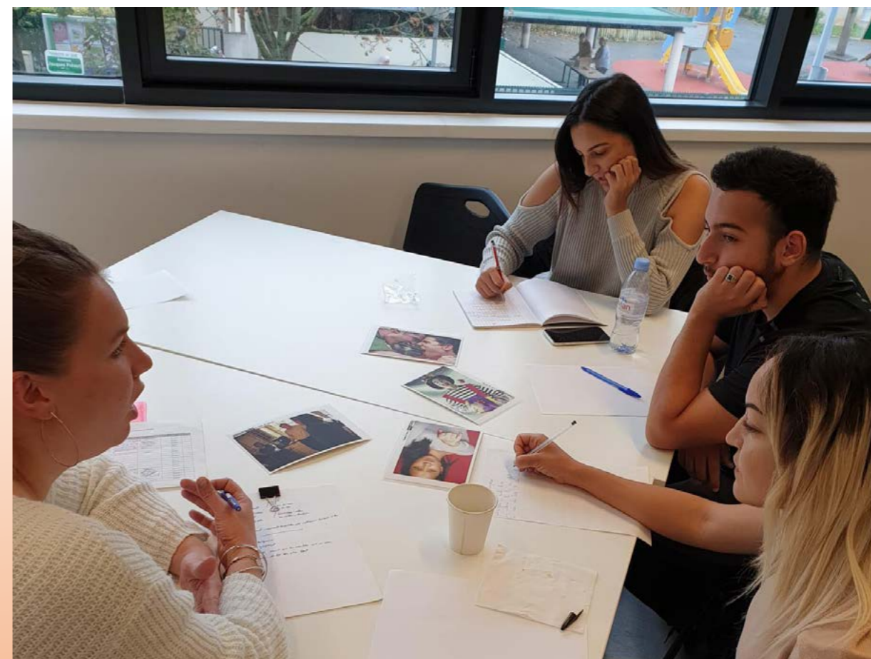
Formation Accompagnement à la scolarité : les Pédagogies Alternatives du 7 octobre

Ce fonds est le moyen d'une ambition politique, « qualifier les acteurs pour qualifier les projets ». Fosfora est constitué d'une partie de la cotisation annuelle des centres sociaux aux Fédérations, que ces dernières reversent à la FCSF (tout comme celles au fonds mutualisé pour le développement du réseau). Un projet pour faire évoluer la gestion de ce fonds sera proposé à l'AG 2020 de la FCSF.