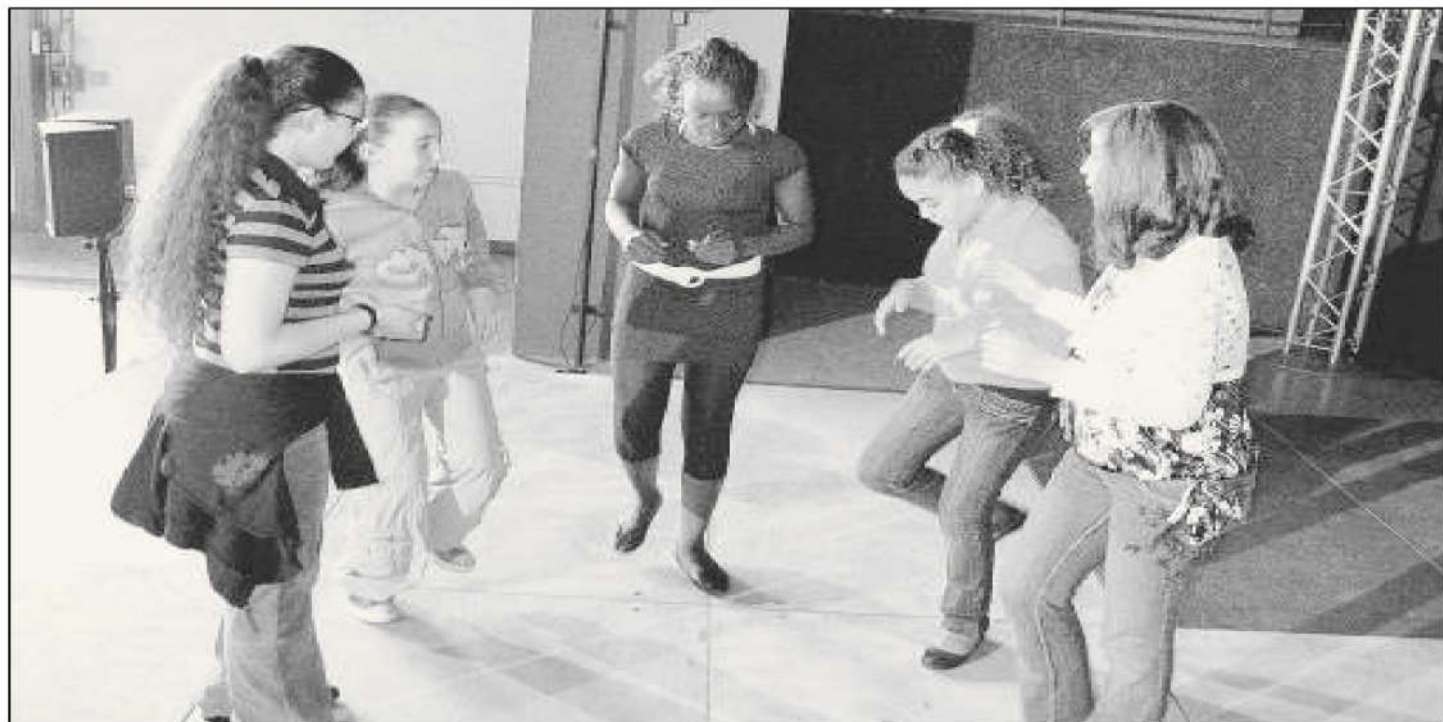
MONTREUIL, HIER, 17 HEURES. Des ados de La Courneuve en pleine démonstration de percussions corporelles. Elles présenteront leur spectacle mercredi à Clichy-sous-Bois.