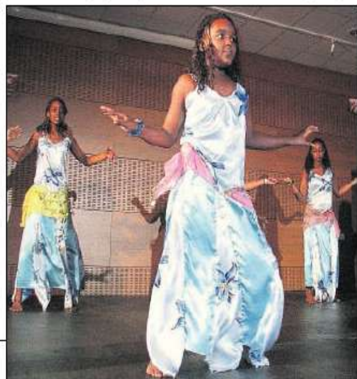
LE BLANC-MESNIL, HIER SOIR. La 9 e édition du festival Transit a été inaugurée. Les jeunes danseuses orientales de La Courneuve étaient de la fête.

Jusqu'au 12 mai. Rens. et programme : 01.43.51.86.80 ou http://festival.transit.free.fr .