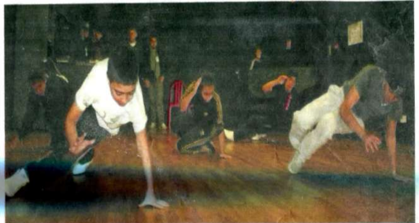
CLICHY-SOUS-BOIS. Ces jeunes danseurs du centre social de la Dhuis participent au grand spectacle d'inauguration du festival Transit, cet après-midi aux Pavillons-sous-Bois.

Quatre-vingt-dix porteurs de projet de différents centres sociaux du département présenteront des expositions de light painting et de Brico'art, et, sur scène, des spectacles de danses hip-hop, orientale, Bollywood, du jazz, une performance graffiti, etc. Invités exceptionnels, les parrains de l'édition 2011, le collectif hip-hop originaire de Bondy Zulu Bam Crew. « Nous les